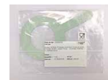
JOINTS GRAVÉS, ÉTIQUETÉS ET EMBALLÉS