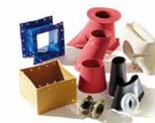
MANCHETTES ET COMPENSATEURS