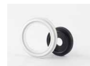
JOINTS ASEPTIQUES (CLAMPS, SMS, D-RING)