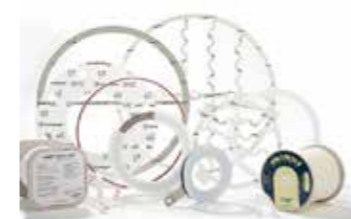
JOINTS ET RUBANS PTFE