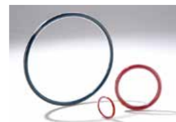
JOINTS TORIQUES (FEP, CHEMRAZ®, VITON®, ...)