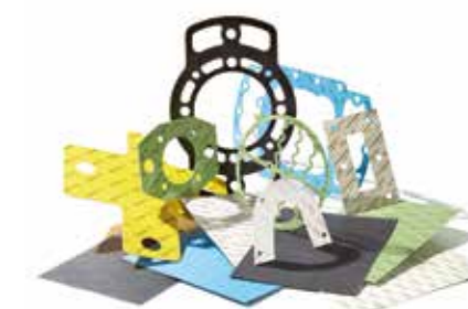
JOINTS FIBRES ÉLASTOMÈRES ET ÉLASTOMÈRES